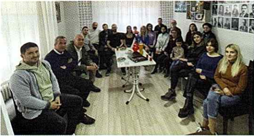
23 Nisan tarihinde Eskişehir Azerbaycanlılar Derneğinde soydaşlarımızla bayramlaşma programı yapıldı.