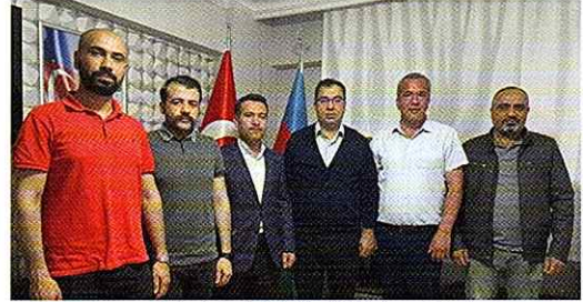
10 Haziran tarihinde Irak Türkleri Kültür ve Yardımlaşma Derneği Eskişehir şubesi Başkan ve Yönetimi derneğimizi ziyaret ettiler.