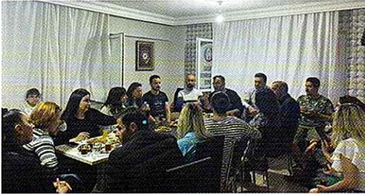
31 Mayıs tarihinde Eskişehir Azerbaycanlılar Derneği üyeleri, Öğrencilerimiz ve Soydaşlarımızın katılımıyla yıl sonu kapanış toplantısı yapıldı.