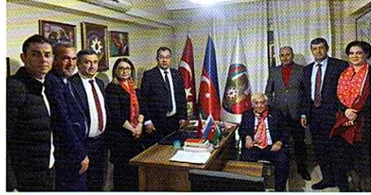
17 Nisan tarihinde Azerbaycan'dan gelen Milletvekili Agil Abbas ve beraberindeki heyet Eskişehir Azerbaycanlılar Derneği yerleşkesini ziyaret etti.