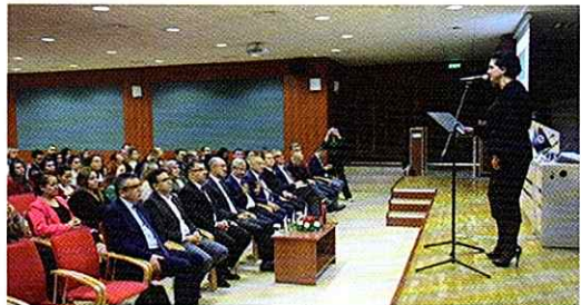
10 Mayıs tarihinde Anadolu Üniversitesi Haydar Aliyev Uygulama ve Araştırma Merkezi tarafından "Haydar Aliyev 100. Yılı" programı düzenlendi.