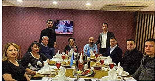
10 Nisan tarihinde Eskişehir Azerbaycanlılar Derneği Yönetim Kurulu, Dernek Koordinatörü, Kadın Kolları Başkanı ve Gençlik Kolları Başkanı iftar sofrasında buluştu ve toplantı yapıldı.