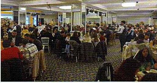
17 Nisan tarihinde Eskişehir Azerbaycanlılar Derneği olarak "Türkiye Azerbaycan Kardeş Sofrası" iftar programımızda Eskişehir'de faaliyet gösteren Sivil Toplum Kuruluşlarıyla buluştuk.