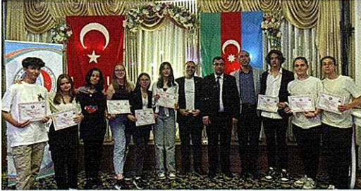
28 Mayıs tarihinde Eskişehir Azerbaycanlılar Derneği tarafından "Azerbaycan Cumhuriyeti 105.Yılı" kutlama programı düzenlendi.