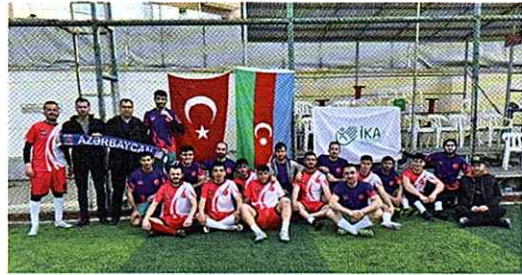
23 Nisan tarihinde İKA'nın desteğiyle Eskişehir Azerbaycanlılar Derneği ve Eskişehir Ulku Ocakları işbirliğiyle "Türkiye - Azerbaycan" Kardeşlik karşılaşması oynandı.