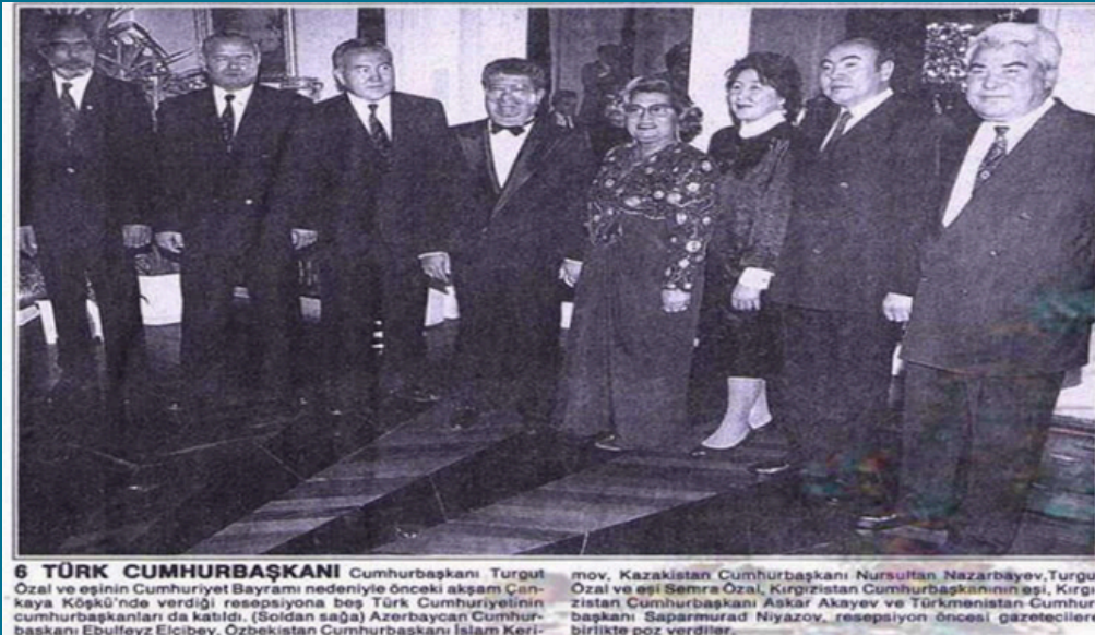
6 TÜRK CUMHURBAŞKANI Cumhurbaşkanı Turgut Özal ve eşi Semra Özal, Kazakistan Cumhurbaşkanı Nursultan Nazarbayev, Turgut Özal ve eşi Semra Özal, Kırgızistan Cumhurbaşkanı'nın eşi, Kırgızistan Cumhurbaşkanı Askar Akayev ve Türkmenistan Cumhurbaşkanı Saparmurad Niyazov, resepsiyon öncesi gazetecilere birlikte poz verdiler.

Manisa ile Azerbaycan'ın Şirvan şehri arasında gerçekleştirilen kardeş şehir çalışmaları da iki şehir arasında yalnızca resmî değil, kültürel ve insani bağların güçlenmesine vesile olmuştur. Bu tür girişimler, diasporanın yalnızca geçmişe değil, geleceğe de temas eden bir yapı olduğunu ortaya koymaktadır.